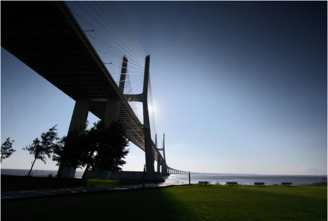
Il ponte Vasco da Gama

Ci sono tante cose da vedere a Lisbona . Però, poiché siamo a bordo di un'auto che rende il viaggio un piacere, cominciamo un'esplorazione dalle ampie vetrate della Peugeot 5008 (compreso il grande tetto panoramico). Imbocchiamo l'autostrada A12 in direzione opposta al centro della città e c'infiliamo sul ponte Vasco da Gama . Perché? Semplice, è altamente spettacolare. Con i suoi 17,2 Km è il ponte più lungo d'Europa e il nono più lungo al mondo. Attraversa il fiume Tago e conduce all'area periferica dove nel 1998 fu allestito l'Expo. Ne valeva la pena.