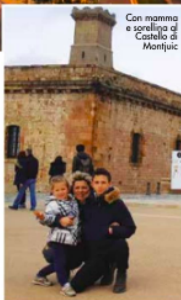
Con mamma e sorellino al Castello di Montjuïc

Barcelona è sempre stata per me una città affascinante, sarà per i racconti sentiti da amici e per le immagini viste su tv: sarà per il fatto che Messi, uno dei migliori calciatori al mondo, giochi proprio in questa squadra, sta di fatto che un mio desiderio era proprio quello di girare per la città rubando attimi di vita degli spagnoli, assaggiare quello che mangiano loro e tifare per la loro squadra... ebbene, grazie a Weekend Premium: il mio sogno si è realizzato: ho trascorso tre giorni e due notti in questa affascinante città con la mia famiglia. Il mio viaggio è iniziato sabato a Malpensa, dopo un'ora e mezza di volo sono atterrato e un autista ha accompagnato me e mio papà al Nou Camp a vedere il derby Barcellona/Espaniol. Lì mi aspettava una sorpresa: la maglia autografata di Messi.