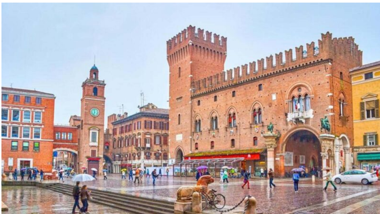
Piazza del Municipio

rinascimentali che si estendono per nove chilometri, è dominato dal Castello Estense , da cui comincia corso Ercole I d'Este , lungo il quale si incontrano Palazzo Prosperi Sacrati , Palazzo dei Diamanti , la Certosa Monumentale , il Tempio di San Cristoforo alla Certosa .