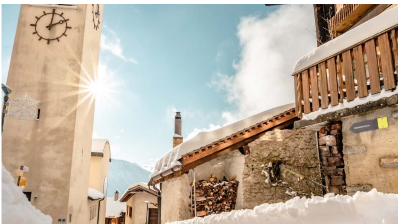
Panorama invernale del Villaggio di Albinen, nel Vallese

impressioni, emozioni e indirizzi utili e partiamo. Tanti i luoghi da vedere almeno una volta nella vita. E allora per aiutarvi nella difficile scelta noi di Weekend Premium ve ne suggeriamo dieci. Posti che, secondo noi e i nostri occhi, valgono un viaggio, regalano emozioni, lasciano un segno, invitano a pensare e riflettere al bello che ci circonda, anche nei luoghi più difficili di questo nostro pianeta. Viaggi tra nature e culture, tra storie e fedi, architetture e paesaggi umani, in un mondo che è sempre più plurale. Anche se qualcuno si ostina ancora a costruire muri.