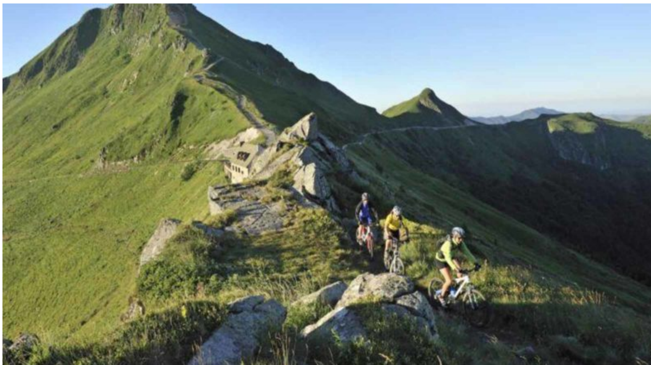
Escursione nel Parco dei Vulcani

La regione dell' Alvernia – Rodano-Alpi , invece, è “green” per definizione, grazie alla presenza dello splendido Parco dei Vulcani, dello Sylatorium, il primo sentiero silvestre di Francia, che si trova a Le Mont Doré.