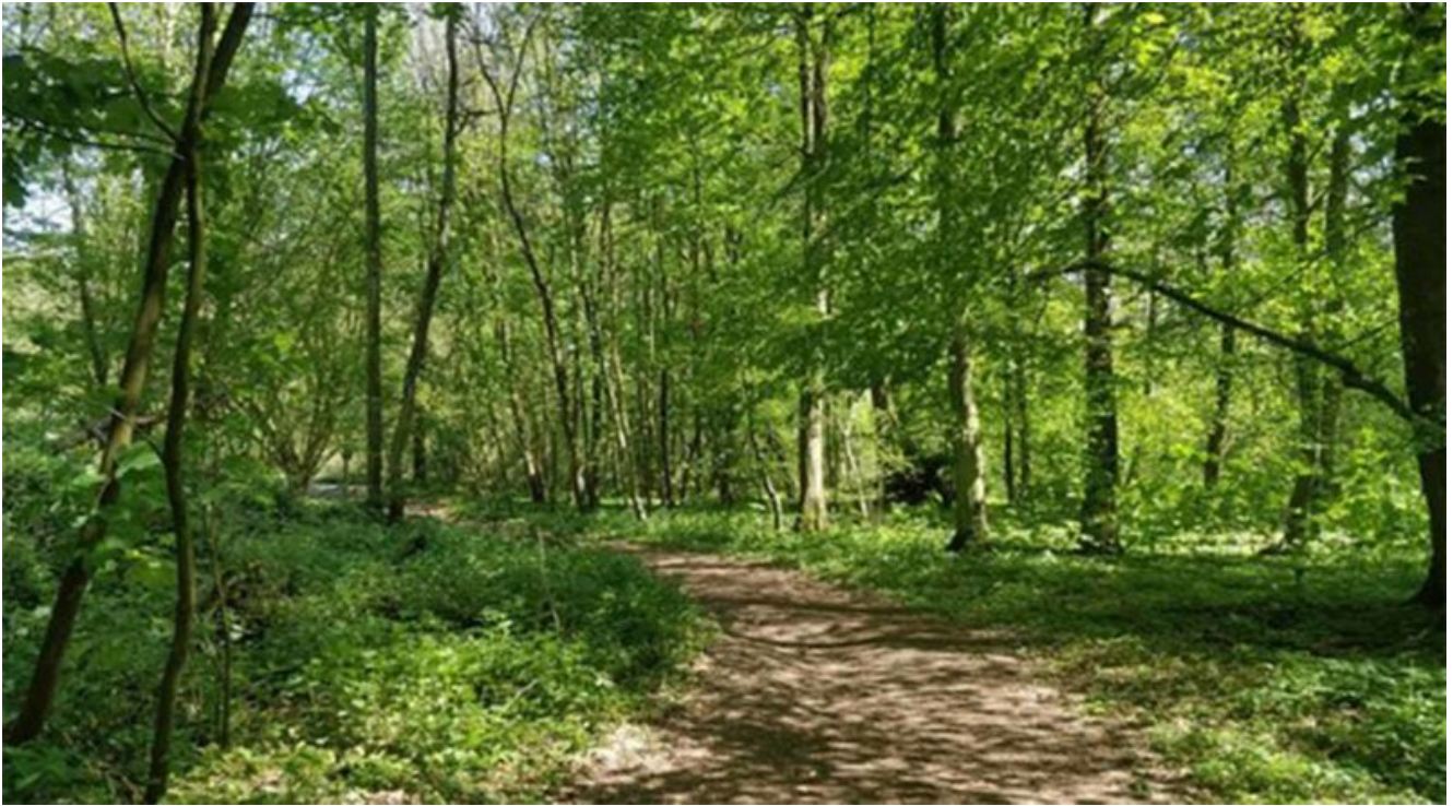
La Forêt de Soignes a Bruxelles

Spostandosi ad Anversa , nel Groen Kwartier , il “quartiere verde”, nella zona sud est della città, dal 2006 ha preso il via il progetto Pakt, un hub sorto in un ex sito industriale per dare spazio a idee imprenditoriali, dallo sport alla ristorazione. Tra questi c'è il progetto dei roof farmer, che offre a chiunque la possibilità di coltivare prodotti locali su un tetto condiviso sotto la supervisione di agricoltori esperti.