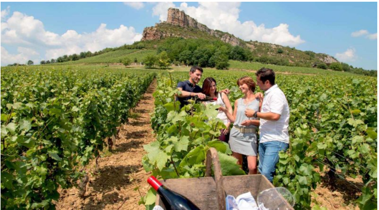
Turismo verde tra i vigneti della Borgogna

Per quanto riguarda invece il turismo verde, spostandosi in Borgogna , la splendida regione dei vigneti, un bell'itinerario eco turistico in bicicletta è quello che da Beaune arriva a Digione, per un totale di 60 km che si snodano attraverso vigneti e splendidi villaggi vinicoli.