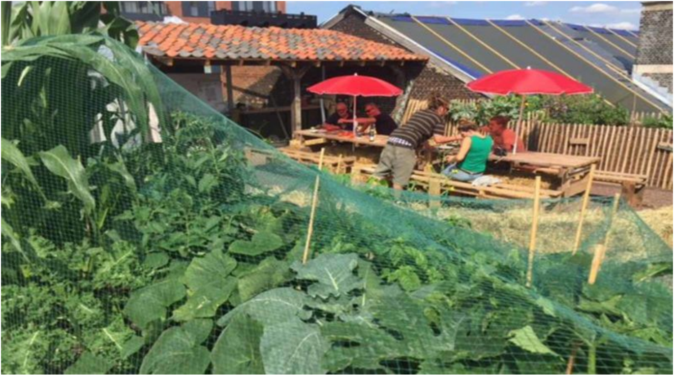
Groen Kwartier ad Anversa

Poco distante da Durbuy, invece, si trova il labirinto di granoturco di Barvaux , composto da 10 km di strade immerse nel verde, tra orti biologici, prati e radure.