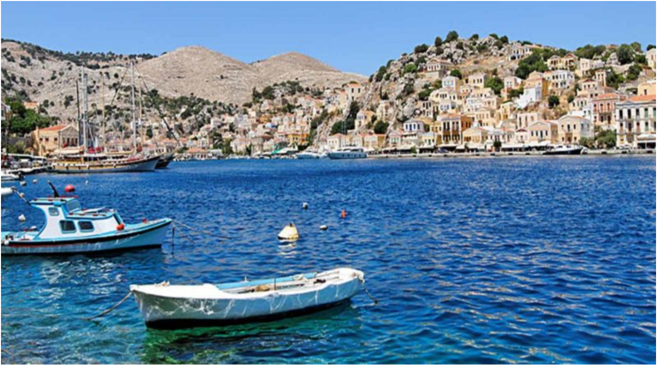
Il porto di Tilos

Anche l'isola di Astypalea , sempre nel Dodecaneso, vanta il primato di prima località greca con mobilità a impatto zero. Grazie a un protocollo d'intesa firmato con Volkswagen, il sistema di trasporti adotta solo veicoli elettrici e si produce solo energia rinnovabile, solare ed eolica. Inoltre, sono stati avviati progetti di car sharing, bike sharing, e-scooter.