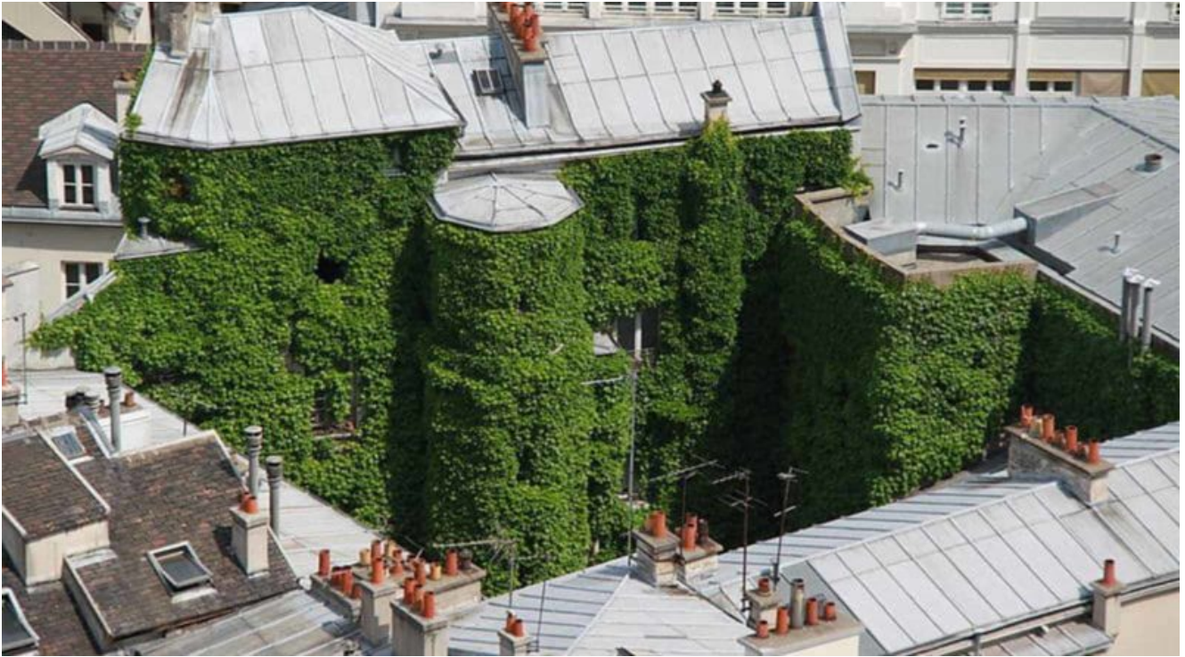
Progetto verde a Parigi

Per quanto riguarda invece il turismo verde, spostandosi in Borgogna , la splendida regione dei vigneti, un bell'itinerario eco turistico in bicicletta è quello che da Beaune arriva a Digione, per un totale di 60 km che si snodano attraverso vigneti e splendidi villaggi vinicoli.