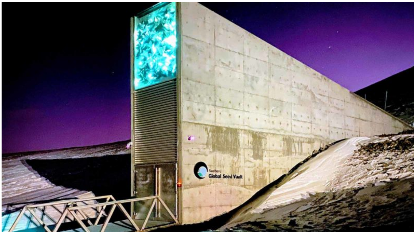
Il Svalbard Global Seed Vault