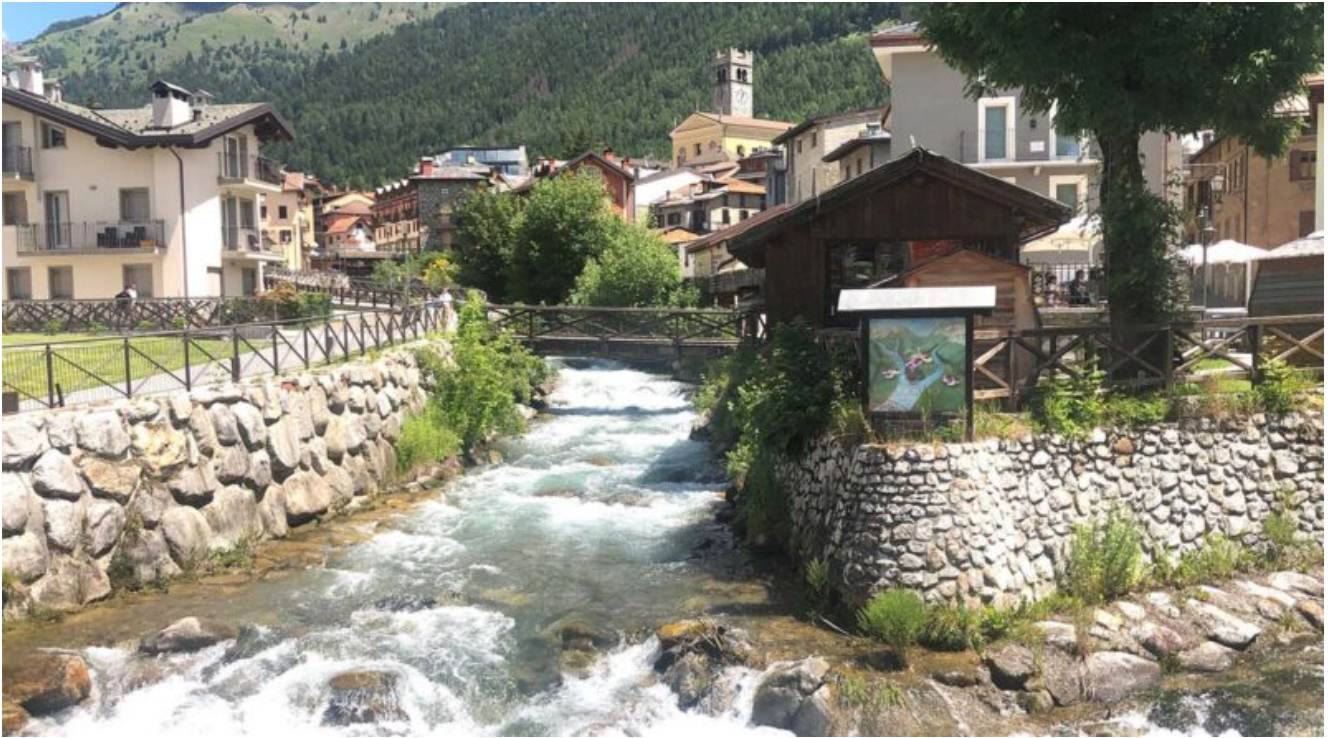
Ponte di Legno

Il paesaggio rispetta bene le aspettative, il torrente che passa e rinfresca, il Wine Bar "La Rasega" che ci offre del buono da mangiare e da bere: salumi e formaggi stagionati in grotta. Si riparte, si scende verso il lago d'Iseo , verso Ospitaletto dove ci aspetta la A4.