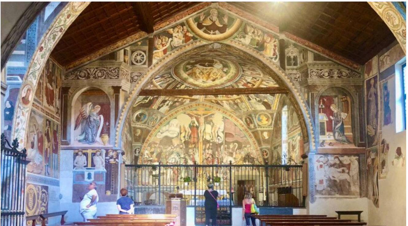
La chiesa di Santa Maria Assunta

La Chiesa di Santa Maria Assunta è a un passo. La porta è sempre aperta, basta spingere. Qui non si ruba, semmai si prega, o si dà una mano per aiutare. Cinquanta centesimi per la luce: e luce fu. L'effetto è commovente, si mi commuovono questi affreschi di Pietro da Cemmo del 1491, sono così diretti, sinceri, arrivano al cuore. Senza fare paragoni, solo per citare, Michelangelo affrescò la vera Cappella Sistina nel 1508.