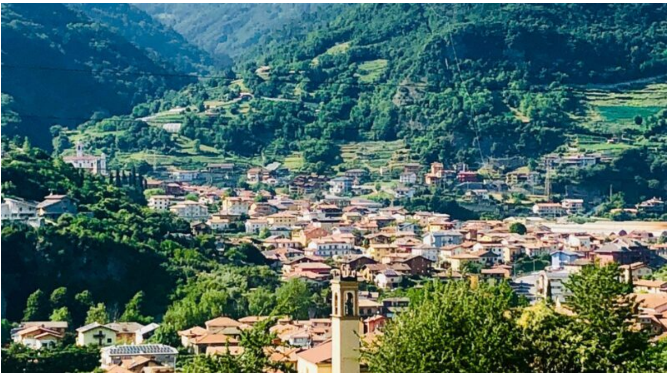
Panorama di Cividate Camuno

Nella prima puntata del nostro viaggio in Valcamonica, il Buono lo abbiamo trovato nel cibo e nel vino e credo che nel troveremo ancora, ma il bello ?