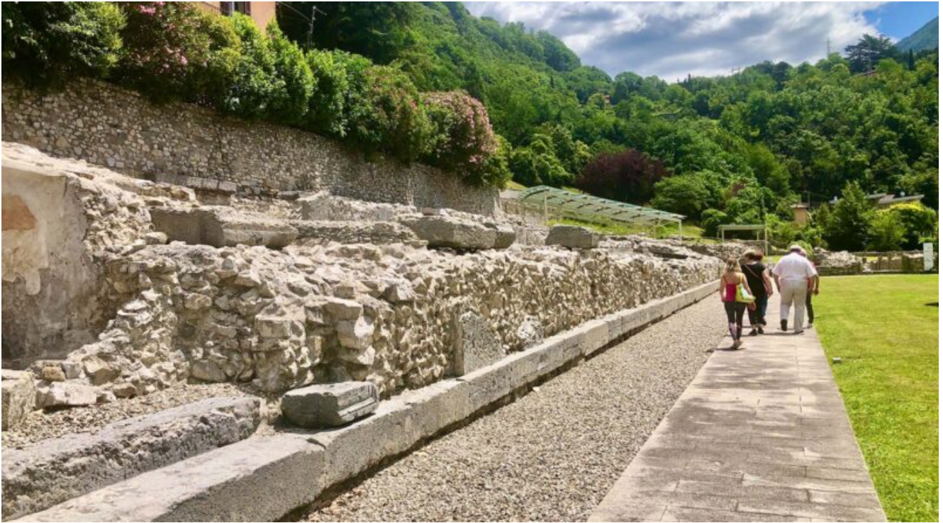
L'anfiteatro romano nel Parco Archeologico

E mai come in questa occasione questa strada, via Tovini n.1 , mi porta davvero a Roma. Certo L'Anfiteatro che vedo non è il Colosseo ed il Teatro non è quello di Taormina , ma l'emozione è tanta per aver trovato in Val Camonica i Romani , oltre che i Camuni . Ci arrivarono nel 15 a.C, quando Augusto sottomise i popoli alpini, che credo gli diedero tanto da torcere, al punto che, in seguito, Roma decise di concedere loro la Civitas Cammunorum , facendoli diventare cittadini dell'impero con una certa autonomia.