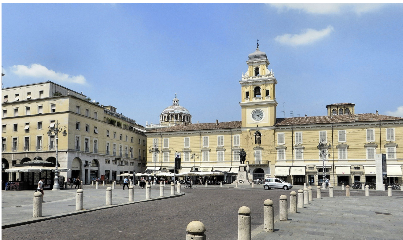
Piazza Garibaldi, Parma, Italia

L'appuntamento di oggi ci porta a Parma , meravigliosa città dell'Emilia-Romagna, per intraprendere un viaggio all'interno del mondo della stampa . Il progetto della Nuova Pilotta infatti il 19 Aprile 2021 si arricchirà di un nuovo gioiello: il nuovo Museo Bodoniano . Si tratta del più antico museo della stampa, inaugurato nel 1963 e dedicato a Giambattista Bodoni, il principe dei tipografi .