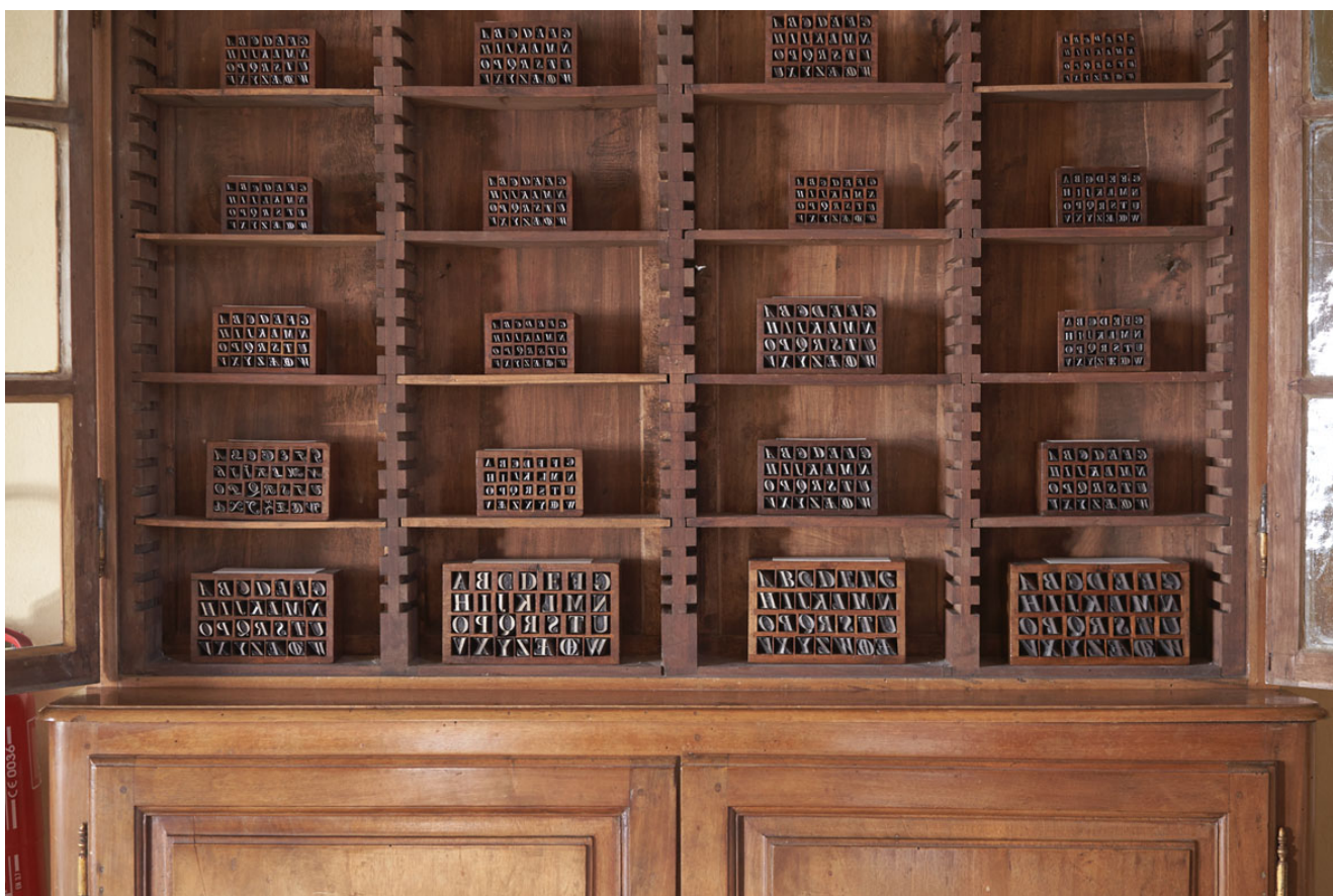
Dettaglio allestimento Museo Bodoniano, Parma

Orari di apertura: Lunedì – Venerdì (9.00 – 13.00) Prenotazione: via email, da inviare entro le ore 13.00 del giorno precedente. Ingresso: gratuito Per info: sito web