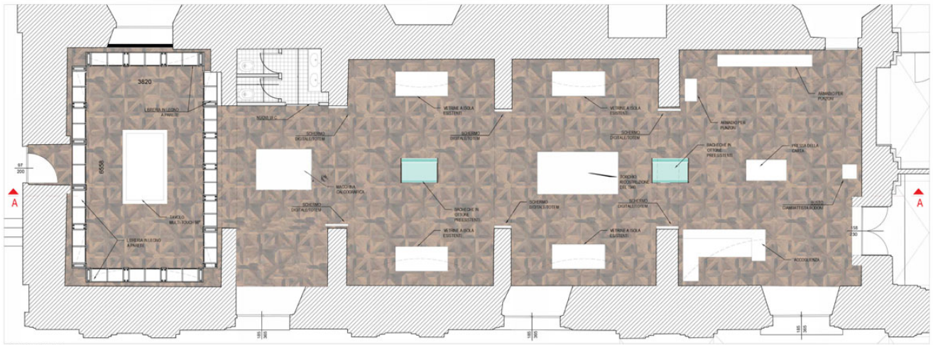
Prospetto visuale museo bodoniano, Parma

Quattro sono le sezioni su cui si svilupperà il nuovo Museo Bodoni. La prima sarà riservata a “Bodoni, Parma e l’Europa” . In questa sezione il visitatore avrà a disposizione una panoramica della produzione tipografica del tempo e dei tipografi di riferimento di Bodoni. A “La fabbrica del libro” è poi riservata la sezione più vasta, che andrà ad occupare la parte centrale della sala espositiva, divisa in quattro grandi nicchie. In ogni nicchia sono ricostruite le varie fasi di lavoro di Bodoni. Per passare a “La stampa” , con prove su carta e pergamena, copie su seta, e il torchio, ricostruzione del 1940, rimesso in funzione anche a fini didattici. Infine “L’illustrazione e la legatura” , presenti anche le lastre di rame relative alle edizioni bodoniane.