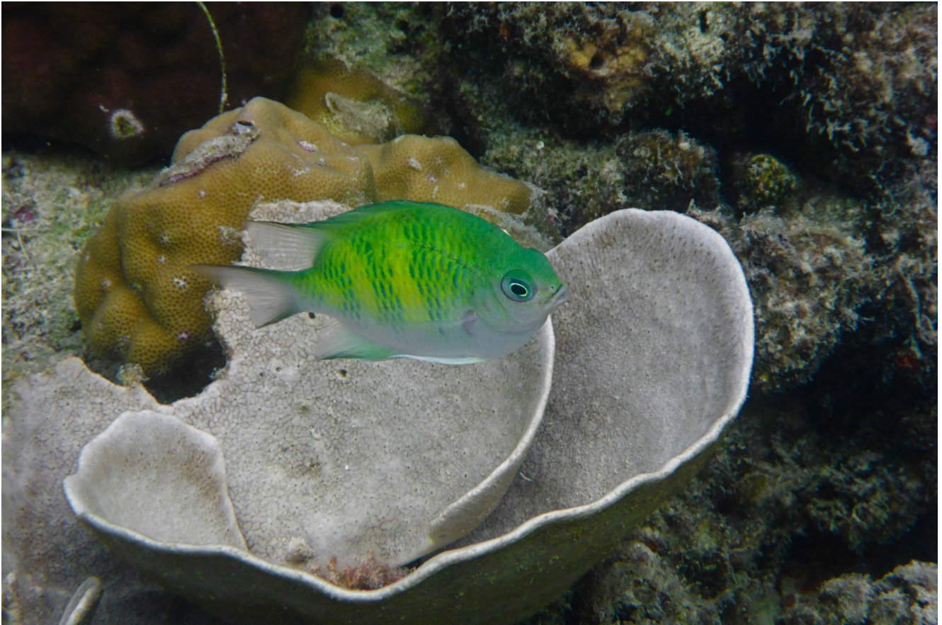
El Nido Filippine

A Purte Princesa troverete una delle 7 meraviglie del Mondo della Natura e riconosciuto patrimonio dell'umanità dall'UNESCO: il Parco Nazionale del fiume sotterraneo di Puerto Princesa "Underground River", un fiume che sgorga da grotte calcaree per tuffarsi direttamente in mare.