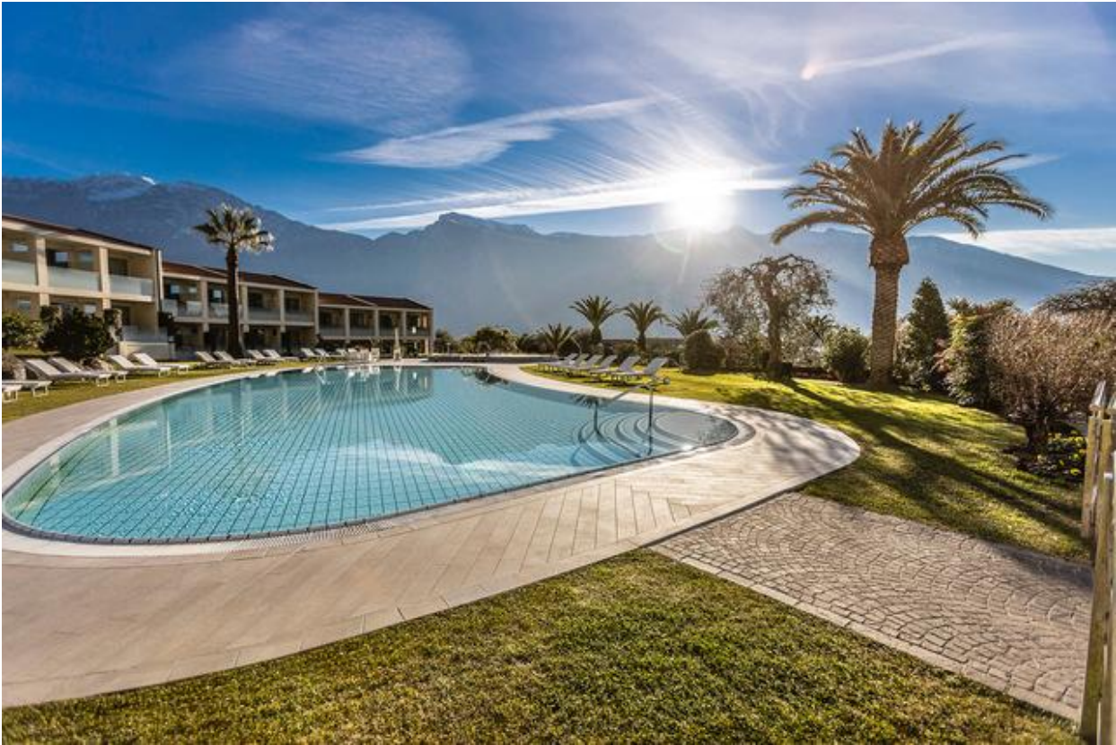
Park Hotel imperial

Il Centro Tao, Natural Medical SPA dell'Hotel è attivo da oltre 30 anni con i trattamenti specifici per la salute e il benessere