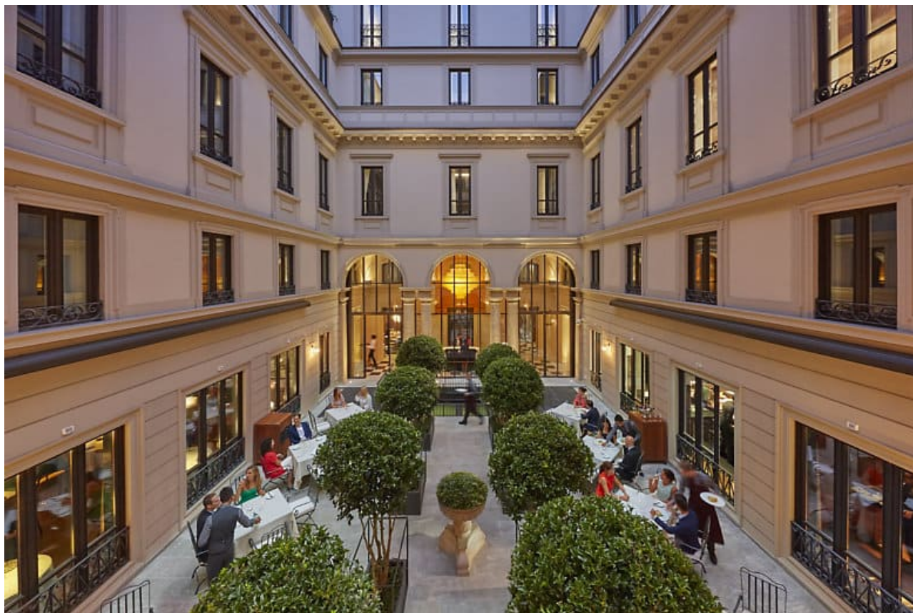
Seta – Cena in giardino