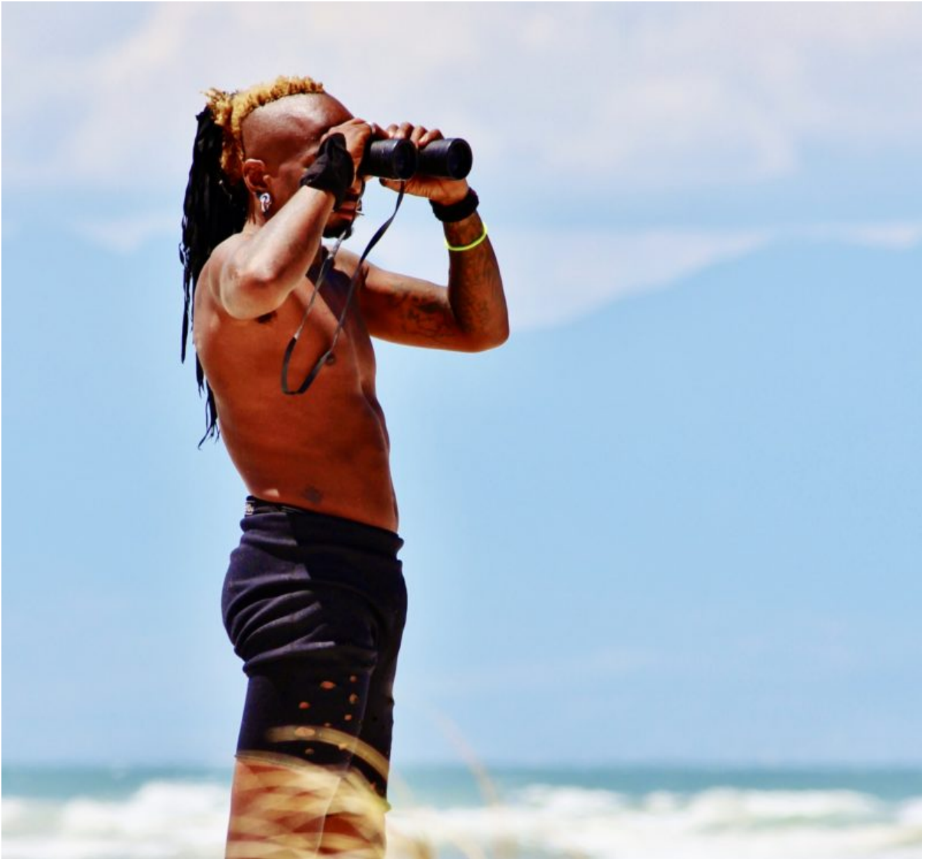
Sudafrica avvisatore di squali