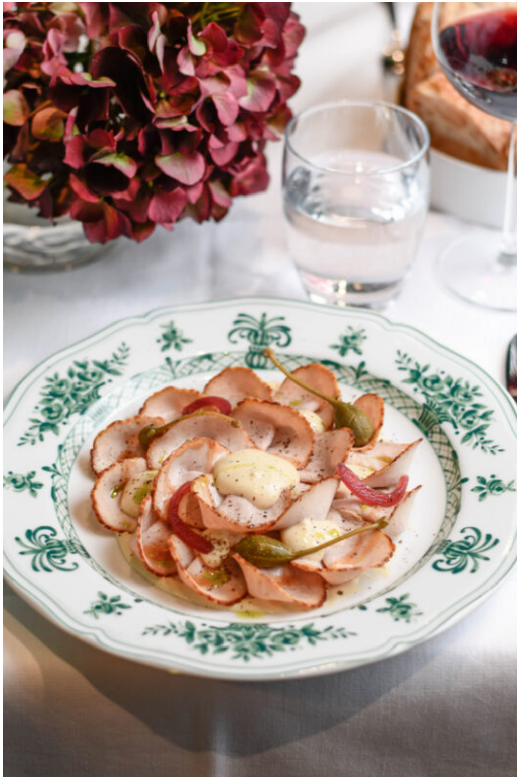
Il vitello tonnato di Stendhal

La carne viene fornita dalla Cascina La Cigolina , un'eccellenza tutta italiana con sede nel lodigiano, a Castelnuovo Bocca D'adda . Stendhal è un vero e proprio omaggio a Milano e alla cucina del territorio. Caratterizzata dai piatti iconici – come il classico risotto “giallo” con ossobuco o i tipici mondeggili, fino alla cotoletta –