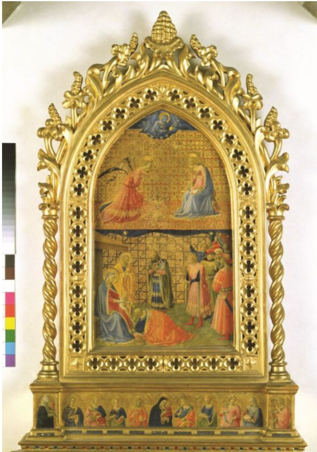
Annunciation and Adoration of the Magi Artwork Location: Museo di San Marco, Florence, Italy

Negli altri otto municipi della città, le biblioteche di zona ospiteranno dal 13 dicembre altrettante importanti opere