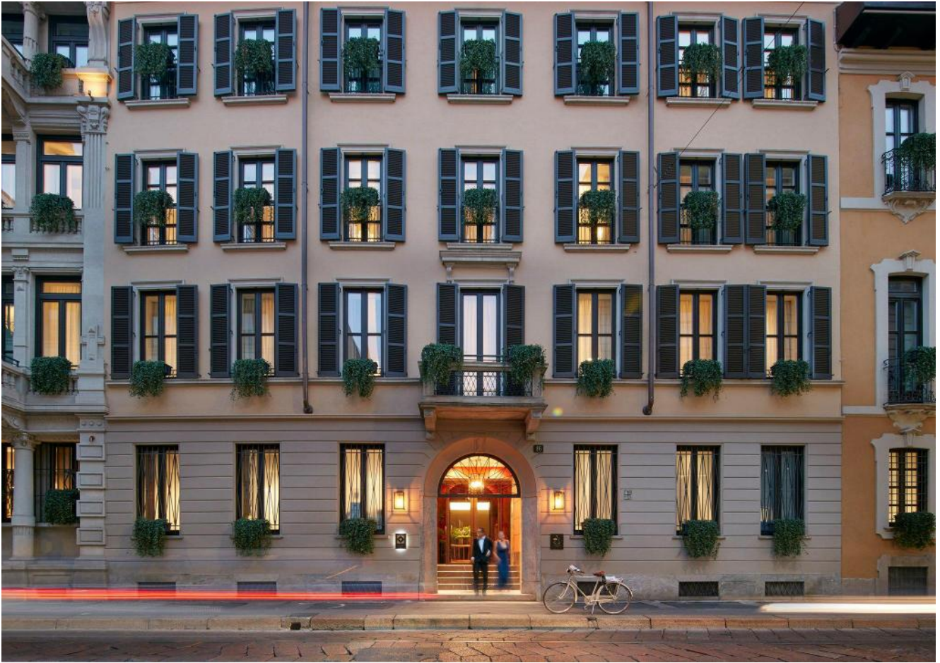
Mandarin Oriental, Milan