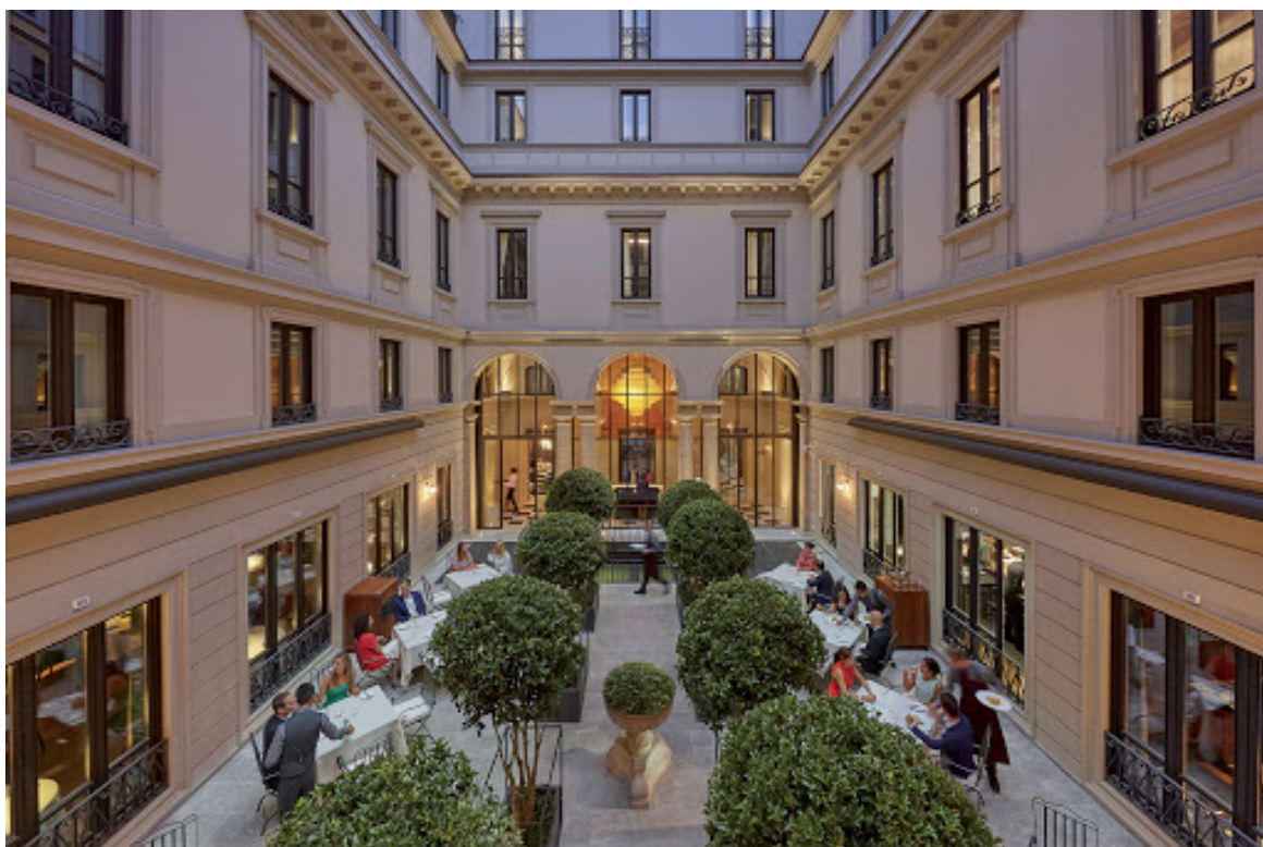
Mandarin Oriental Milan cortile