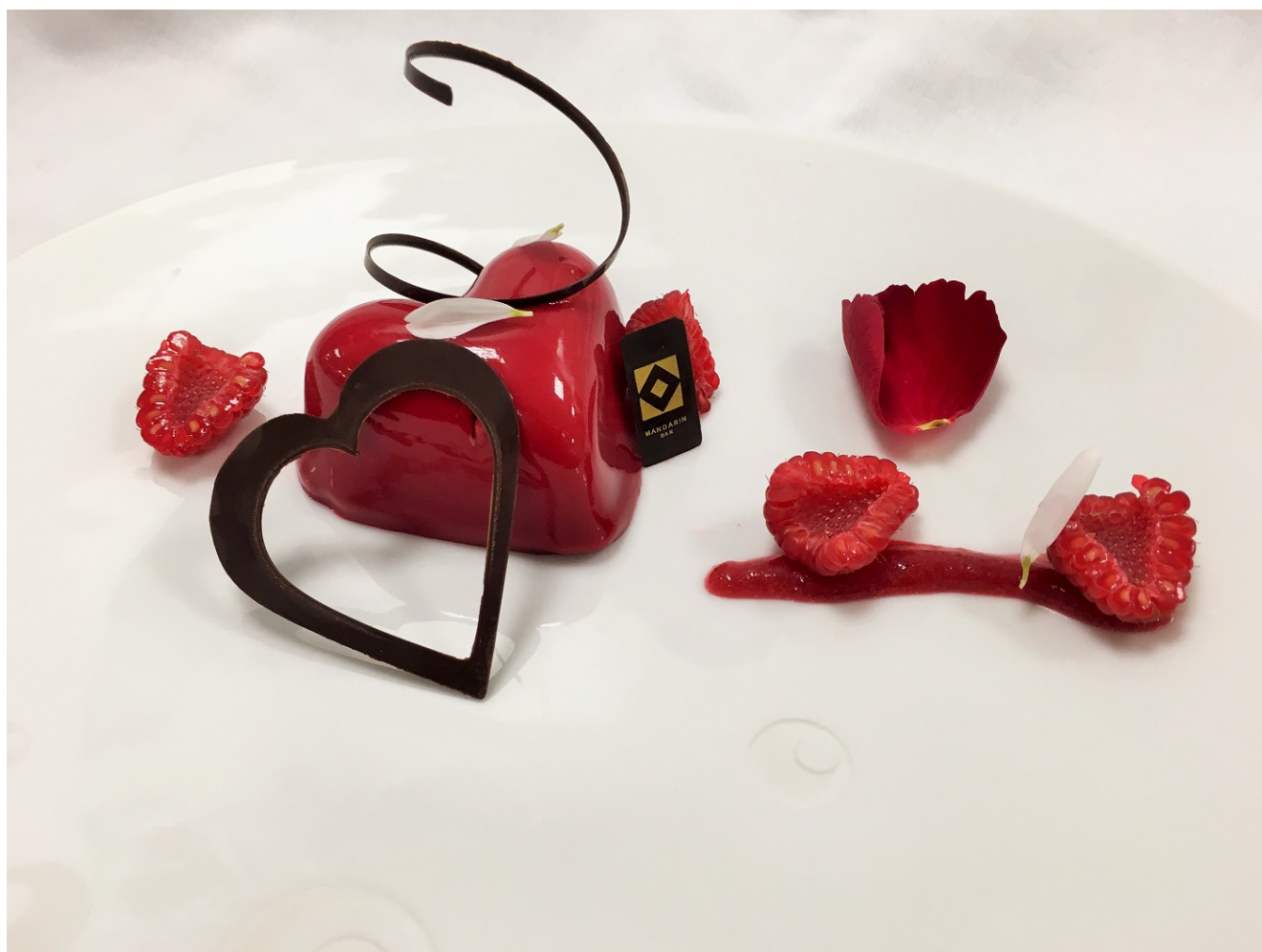
menu San Valentino Mandarin Oriental Milan

Per il giorno di San Valentino, Chef Guida ha poi ideato uno speciale menù gastronomico dai sapori netti e decisi: dal Risotto all'anice stellato con polvere di cavolo nero al Capriolo con crema di cavolfiore, mandorle e yuzu , per concludere con l'intrigante dessert Cre moso a base di fava tonka, chantilly ai frutti esotici e cuori di cioccolato .