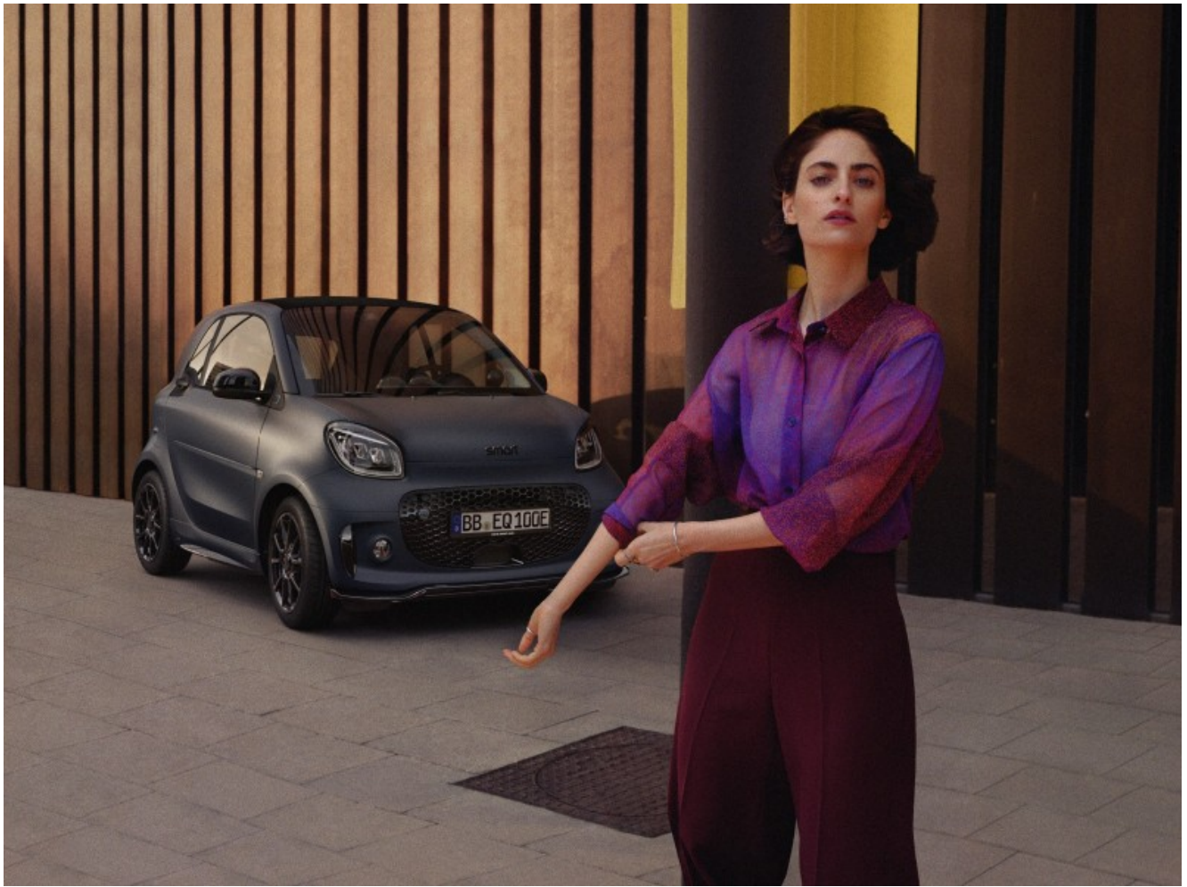
Smart EQ fortwo edition bluedawn

La clientela femminile che per diletto o necessità percorre in lungo e in largo le strade congestionate di una grande città, finalmente può contare su una nuova compagna di viaggio agile e attenta all'ambiente. Stiamo parlando della Smart EQ fortwo edition bluedawn, serie speciale della citycar 100% elettrica in grado di garantire un'autonomia di 159 chilometri nel ciclo NEDC.