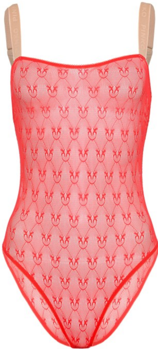
Intimo Pinko San Valentino