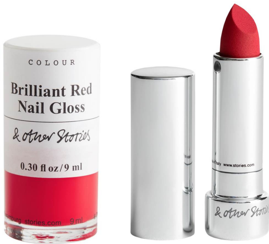
& Other Stories Lip Colour 'Scarlet Red'