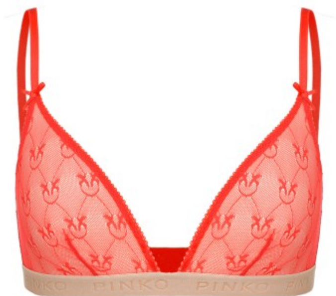
Intimo Pinko San Valentino