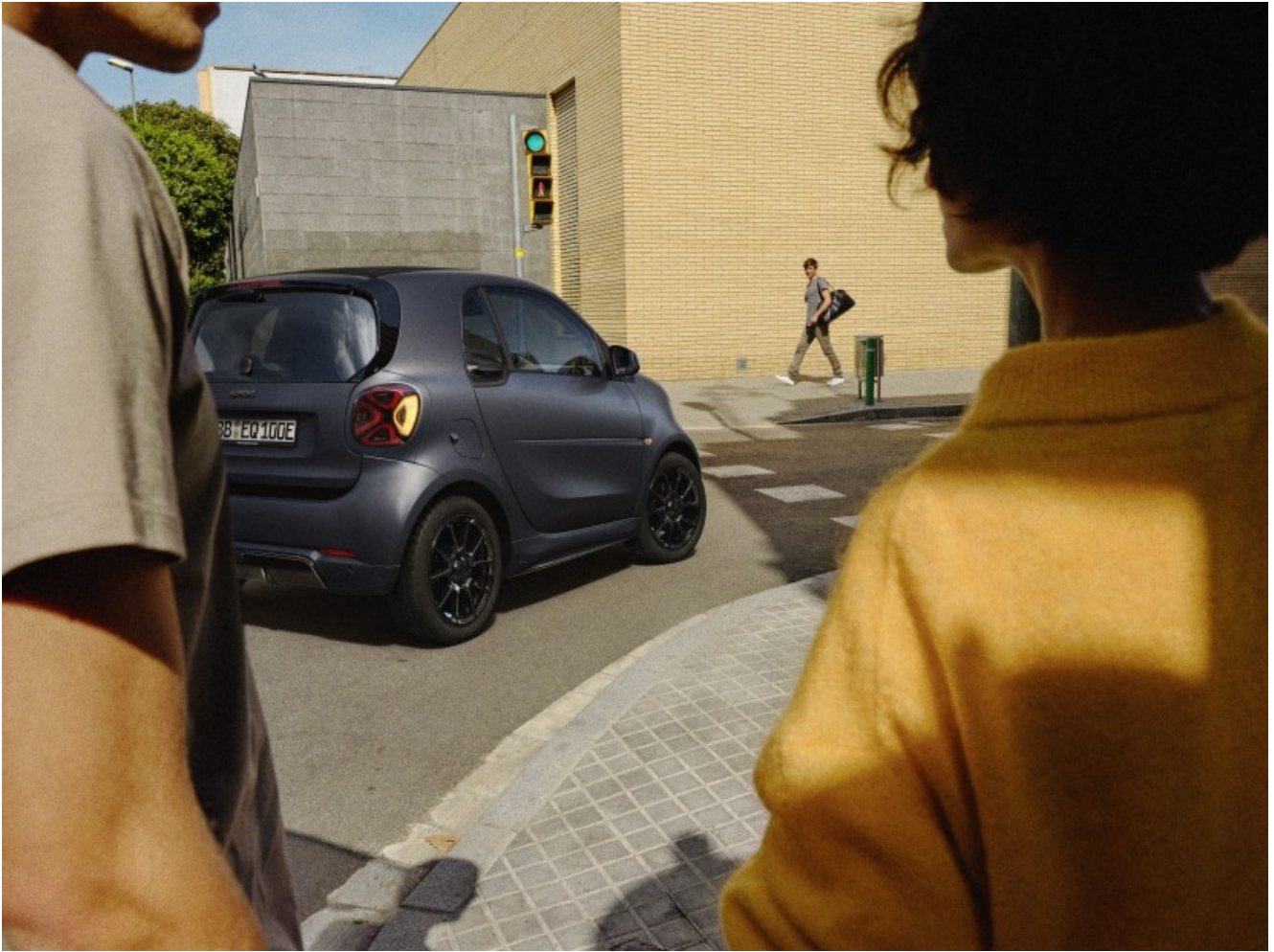
Smart EQ fortwo edition bluedawn blu matt velvet

Questa nuova ed esclusiva edizione limitata, disponibile in soli 400 esemplari, sfoggia una lunga serie di elementi distintivi, tra cui spiccano il bodypanel e la cellula di sicurezza tridion in blue matt velvet. Il look elegante e dinamico allo stesso tempo è ulteriormente accentuato da diversi dettagli BRABUS in blue matt velvet o nero lucido.