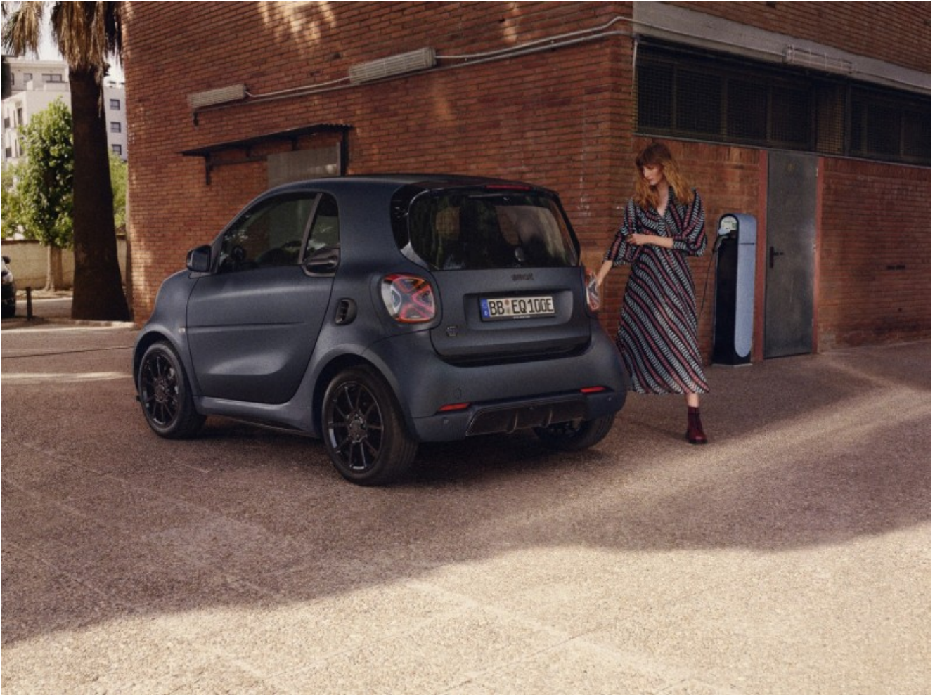
Smart EQ fortwo in ricarica

La bluedawn è disponibile esclusivamente su Smart EQ fortwo coupé, con prezzi a partire da 32.195 euro per la versione con caricabatterie di bordo da 4,6 kW, 500 euro in più scegliendo quello da 22 kW. Con quest'ultimo è possibile ricaricare la batteria dal 10 all'80% in meno di 40 minuti.