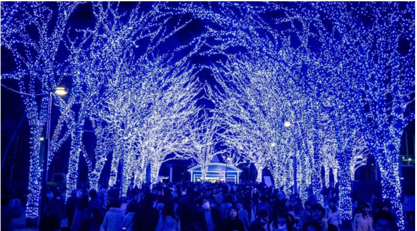
La Blue Cave a Shibuya

Il Giappone ha una vera e propria passione per le luci e per questo per le festività natalizie e per quelle di fine anno il paese risplende di mille colori. Nella capitale, Tokyo , per esempio, ogni centimetro della città è illuminato, a partire dagli alberi di ciliegio, fino alle piste di pattinaggio su ghiaccio ai lampadari di cristalli colorati. Una delle strade più suggestive è certamente la Shibuya Ao no Dokotsu , un pedonale di 250 metri che si trasforma in una spettacolare grotta blu con luci al LED e lastre riflettenti.