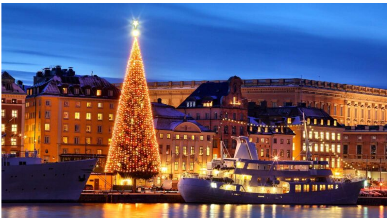
Luci di Natale a Stoccolma

Nel mese di dicembre, la capitale svedese si accende di più di un milione di luci a LED che illuminano più di 40 strade e piazze, senza contare alberi di Natale giganteschi, installazioni a tema, tra renne a grandezza naturale, fluttuanti cuori rissi e archi dorati e scintillanti. Un vero e proprio “paese delle meraviglie” che si illumina a partire dal 13 dicembre , in occasione della sentitissima Festa di Santa Lucia , la Santa della Luce. Nella “notte più lunga” migliaia di bambine sfilano per le strade indossando una veste bianca e una coroncina di candele sulla testa, portando una candela accesa in mano.