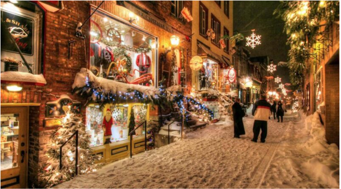
Le stradine di Vieux Quebec a Natale

Questo delizioso mercatino si articola su due livelli ed evoca un villaggio alpino. Una parte delle casette, infatti, si trova nel giardino dell' Hotel de Ville , mentre un'altra parte si concentra attorno alla Basilica di Notre Dame de Quebec , ed è circondato da luminarie mozzafiato. Ancora pochi passi e si arriva a un'altra imperdibile attrazione, la Boutique de Noel , un negozio che sembra uscito da un film di Natale in cui si può trovare davvero di tutto. Spostatevi poi al Vieux Port , illuminato da splendide luci natalizie, dove si tiene fino al 3 gennaio un Marché de Noël , con prodotti tipici della regione francese del Canada.