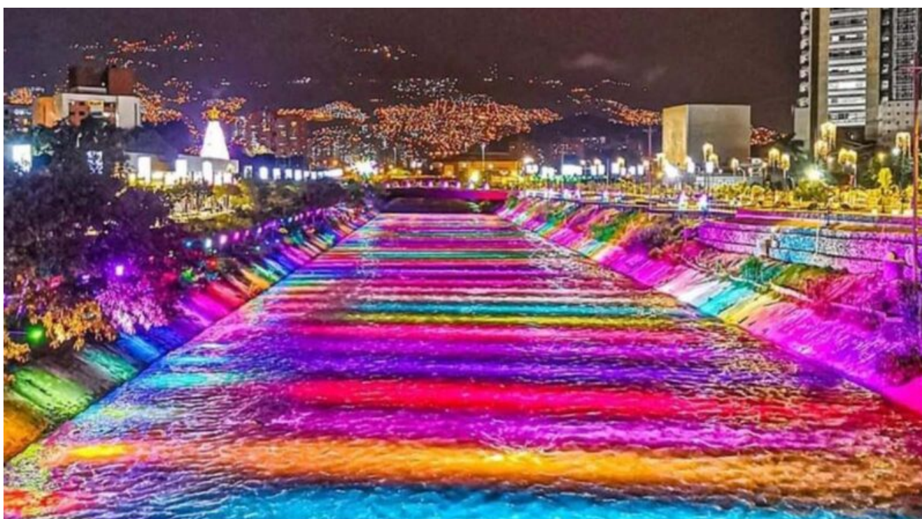
Luci di Natale sul Rio Medellin

Ogni anno a Natale la città colombiana di Medellin si accende con uno degli spettacoli di luci e colori più belli del mondo, El Alumbrado , cioè "L'Illuminazione". Per l'occasione, vengono accese più di 20 milioni di luci al LED che formano castelli, arcobaleni, barche, pesci e ogni forma fantasiosa e fanno da sfondo a un ricco programma di spettacoli e concerti che animano le vie della città e lungo il suggestivo Rio Medellin .