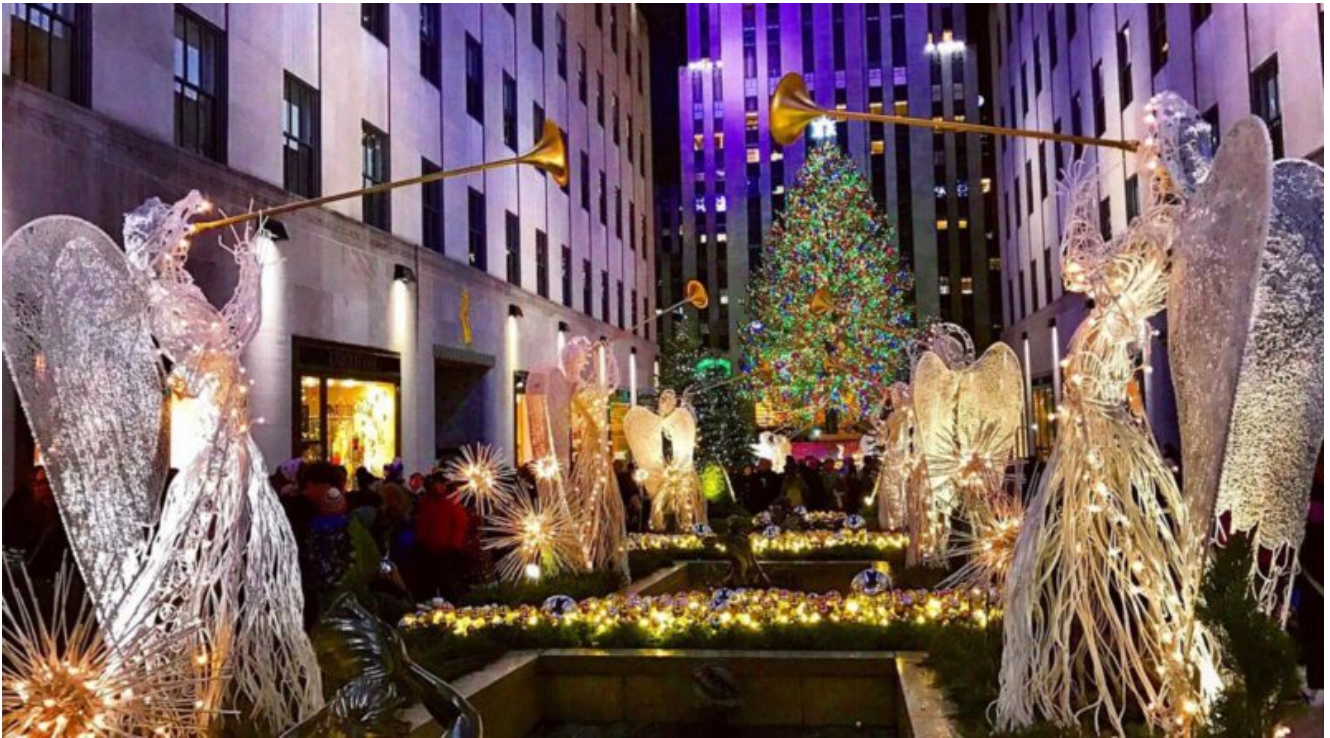
Gli angeli del Rockefeller Center

con migliaia di luci che cambiano continuamente colore, dal verde al rosso all'oro.