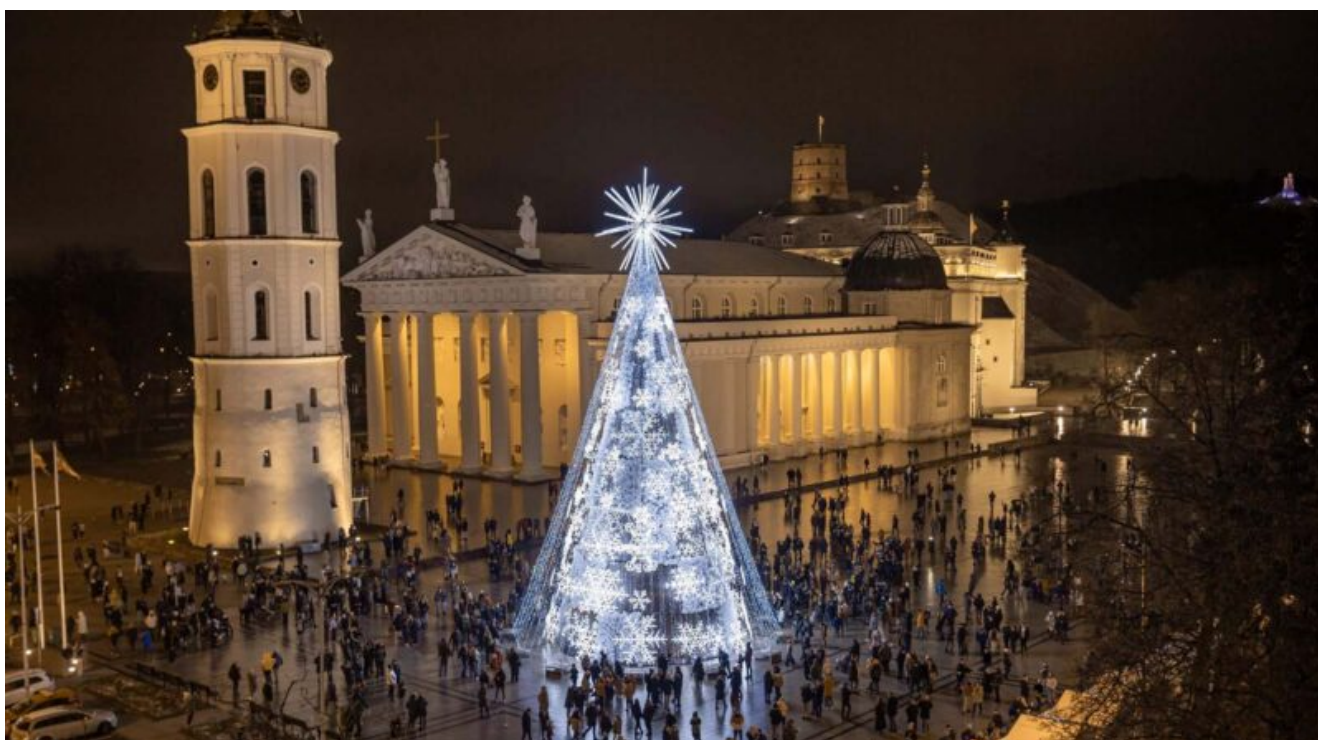
Il gigantesco albero di Natale di Vilnius09

immagini e giochi di luce, mentre un delizioso trenino attraversa il centro storico per ammirare le strade addobbate per le feste.