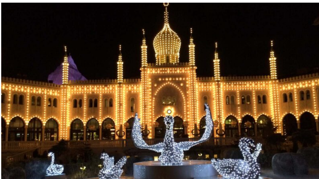
I Giardini di Tivoli vestiti a festa

Nella nostra TOP 10 anche la città della Sirenetta che vanta uno dei Mercatini di Natale più belli d'Europa e che per le feste si lascia avvolgere da migliaia di luci colorate e atmosfere fiabesche. Grandissimi alberi di Natale adornano strade e piazze, ma anche luci e candele colorate le cui luci si riflettono sulla candida neve dell'inverno danese. Seguendo le ghirlande di luci si arriva al mercatino di Julemarked, nella città vecchia, da cui parte una strada pedonale di circa un km che si costeggia vetrine e negozi addobbati a festa.