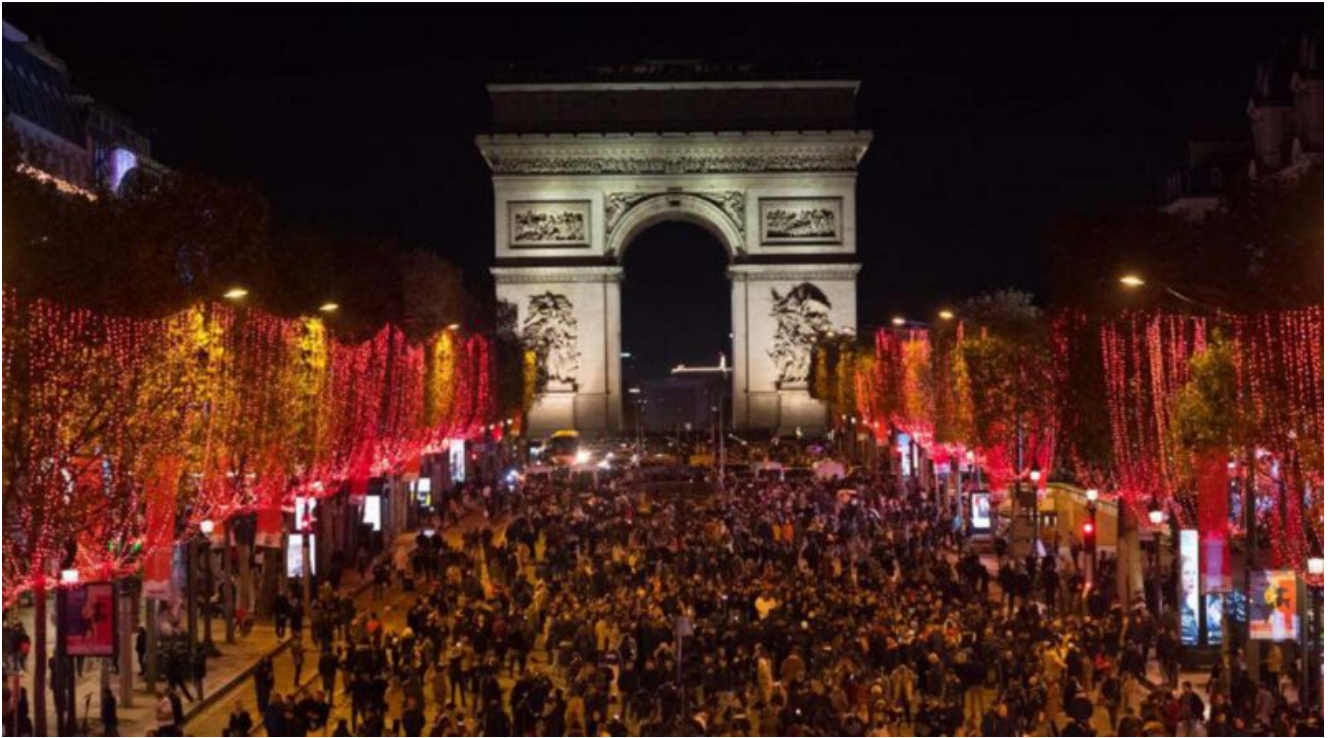
Natale sugli Champs-Élysées

Qui viene allestito anche un suggestivo Marché de Noël , il tradizionale mercatino di Natale con oggetti di artigianato, prelibatezze, addobbi e specialità a tema. Di fronte alla Cattedrale di Notre Dame , invece, si può ammirare un grande albero di Natale. Per i patiti dello shopping, poi, il vero paradiso sono le Galleries Lafayette , in Boulevard Haussmann, nel IX Arrondissement e le suggestive atmosfere di Montmartre. In generale, però, tutta Parigi a Natale merita una visita, poiché non c'è vetrina, strada o balcone che non si illumini a festa per celebrare il Natale.