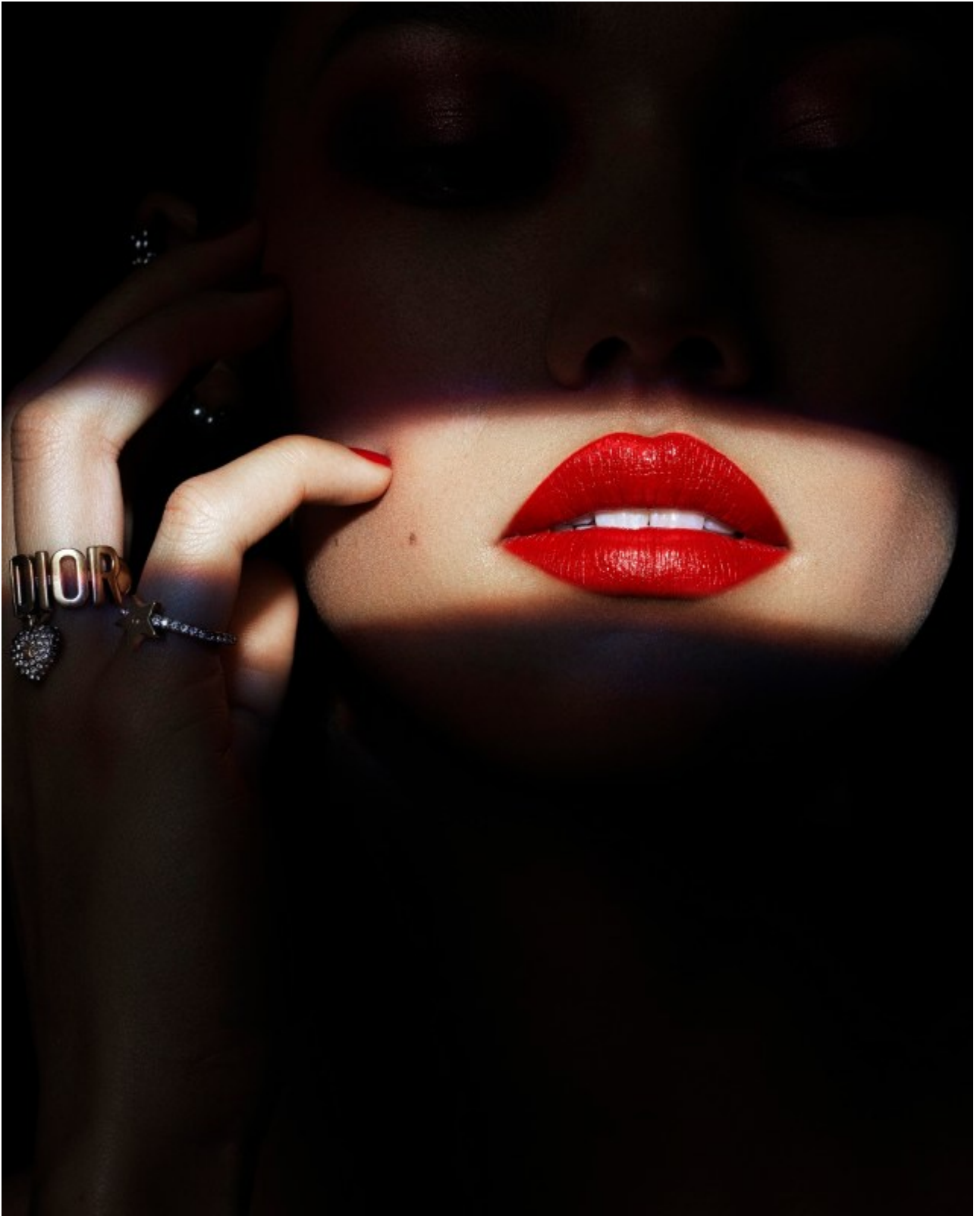
DIOR – Halloween 2020