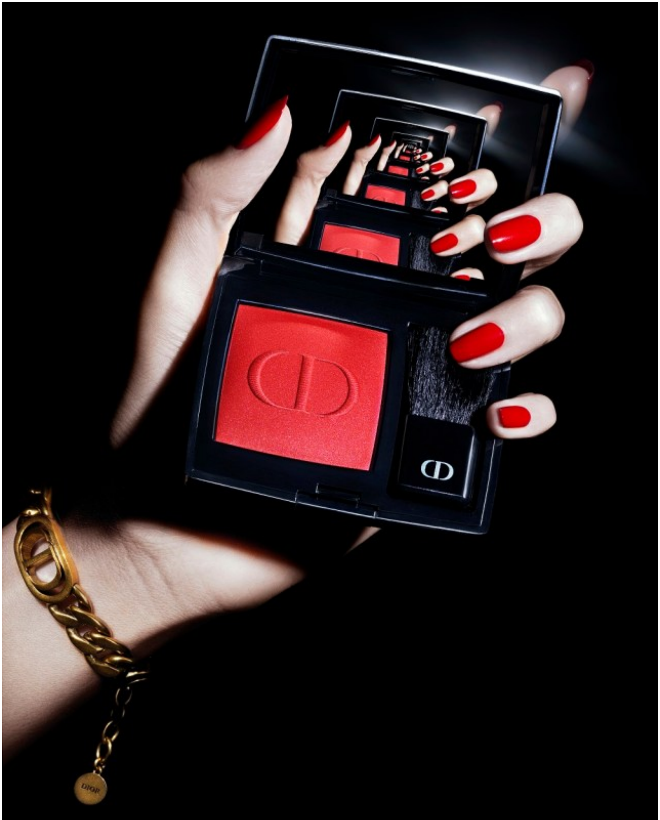
DIOR – Halloween 2020