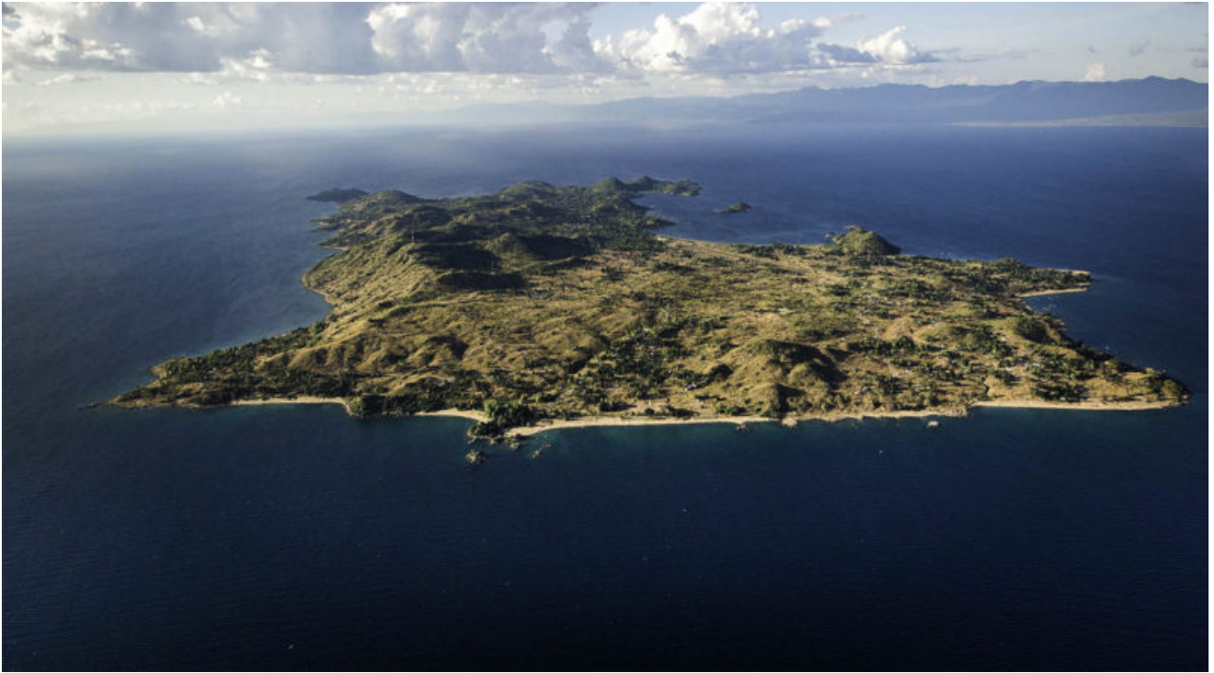
Veduta aerea di Likoma Island