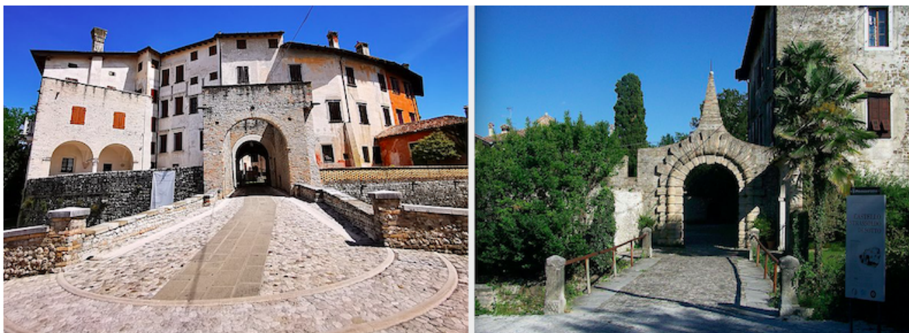
Strassoldo e Valvasone

La Strada del Vino e dei Sapori del Friuli Venezia Giulia offre più di 150 esperienze enogastronomiche integrate per passare una giornata all'insegna del gusto e della scoperta delle tradizioni food&wine. Scoprirete vigneti, cantine, malghe, riserve naturali, lagune, il golfo di Trieste, oltre ai frutteti e uliveti dove nascono le eccellenze del territorio. E alcuni dei borghi più belli d'Italia come Strassoldo e Valvasone