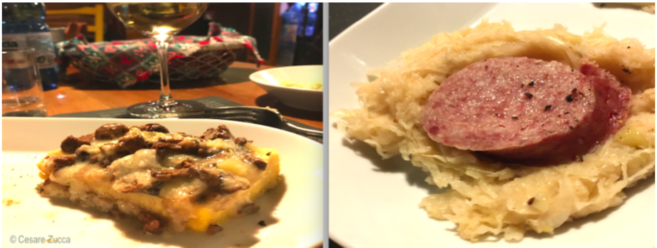
Piatti tipici della cucina friulana

enogastronomica regionale, ricca di piatti che gli chef locali fanno proporre facendo esprimere al massimo le materie prime friulane