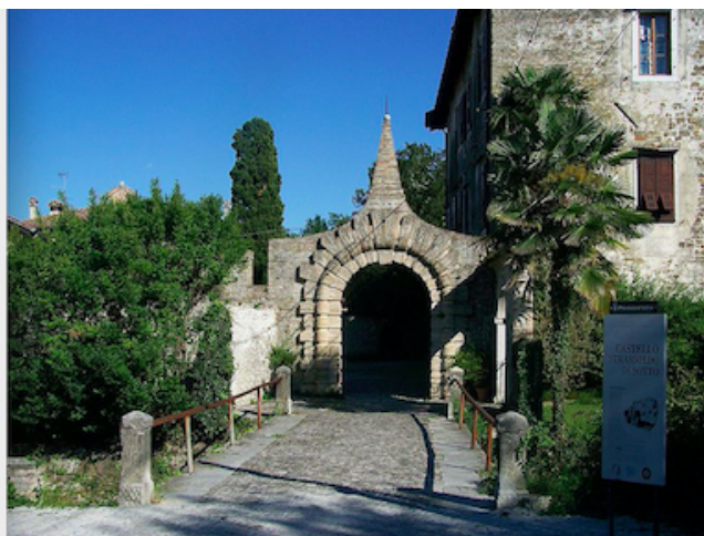
Strassoldo e Valvasone