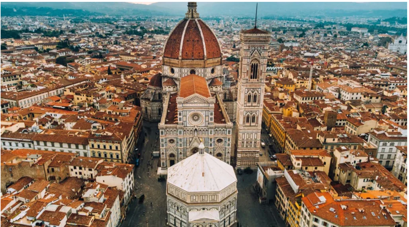
Firenze, una delle città d'arte più visitate

Chi è il nuovo viaggiatore culturale ? È un turista sempre più consapevole e attento a tutto ciò che ci circonda, dai monumenti, alle tradizioni del made in Italy, alla sostenibilità. E c'è un nuovo modo di viaggiare rispetto al passato, quando fare turismo voleva dire soltanto spostarsi da un punto all'altro del globo.