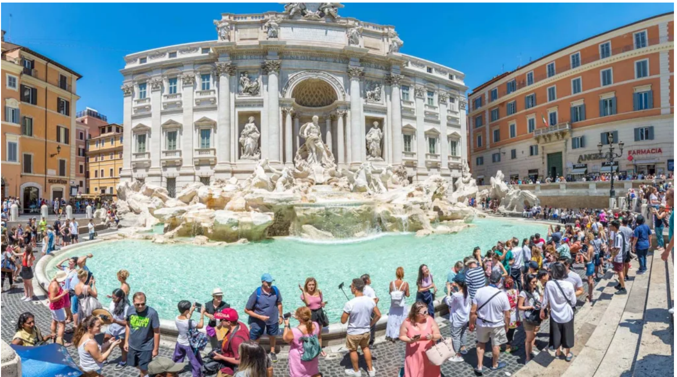
Overtourism a Roma

Off season tourist: il nuovo turista è colui che rifiuta il solo sguardo veloce e superficiale perché preferisce esperienze più profonde e immersive che gli permettano di entrare veramente in contatto con la destinazione.